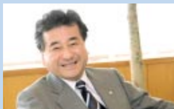
吹田市長 阪口 善雄 様