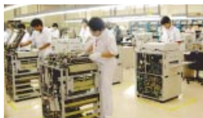
リコータイランドの再生機生産ライン

販売会社リコータイランドでは、2003年度から、本格的な複写機の再生機生産を始め、タイ国内で販売してきました。2004年度は、市場からの回収台数増加に伴い、再生機生産ラインの拡充・工程改善を実施しました。生産工程を見直し、「作業チェック」「作業指導」「再生作業」「プロセス全体の管理」のそれぞれに担当者を設定することにより、高品質な再生機を効率良く生産できるようになりました。アジア・パシフィック極の再生機の40%以上が、同社で生産されています。