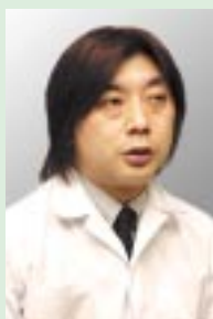
MFP事業本部 設計センター 第一設計室 設計三グループ グループリーダー