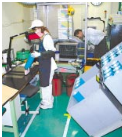
使用済みOPCの再生工程

ドラム原料であるアルミ合金の資源量に換算すると7.7トンを削減することができました。この取り組みによる年間のCO 2 削減量は71.3トンです。