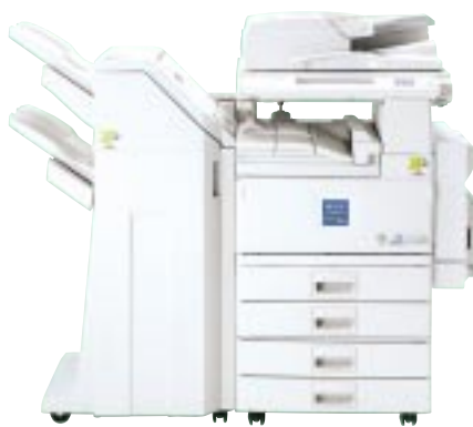
再生デジタル複合機 imagio Neo 450RCにオプションを装着したものです。

2001年12月に、再生デジタル複合機「imagio MF6550RC」を発売して以来、再生機のラインナップを拡充してきました。2003年度には、35枚/分機から70枚/分機までの再生機ラインナップが揃い、より多くのお客様のニーズに対応できるようになりました。さらに2004年度は、リコー独自の省エネ技術「QSU」を搭載し、エネルギー消費効率の向上と10秒の高速立ち上げを実現した「imagio Neo 350RC/450RC」を加え、さらにラインナップが充実しました。より多くのお客様のニーズに対応できるようになったことで、販売台数も順調に伸びています。再生機は、部品の82%以上(質量比)を再使用しており、ライフサイクル全体の環境負荷も約40%削減(imagio Neo 350/450RC)しています。