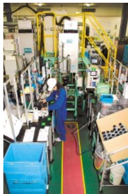
2畳ほどのスペースがあれば、誰でも簡単にトナーの充填再生が可能。

リコーはトナーボトルのリユースの拡充を進めています。サテライト充填とは、回収したトナーボトルを生産拠点まで戻さずに、よりお客様に近い回収センターでボトルの再生とトナーの充填を行い、製品として出荷する仕組みで、ボトル輸送時の環境負荷削減とリードタイムの短縮が図られます。この仕組みは、小型のトナー充填装置である「オンデマンドトナー充填機」により実現しました。2004年度は九州、東海、関東、東北エリアで充填を行い、年間32万本のトナーを出荷しています。2005年度には、近畿、中国・四国、北海道にも展開し、全国をカバーする計画です。LCA評価では、再生トナーボトルは新造品に比べ、ボトル製造における負荷と物流の負荷が削減されるため、CO 2 排出量を87%削減できます。