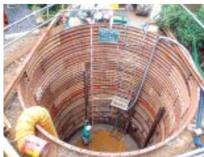
土壌掘削除去工事(リコー大森事業所)

右ページの表の通りです。汚染が確認された事業所では、詳細調査・浄化活動を行っています。汚染が確認された事業所を含む全ての事業所で、周辺地域への影響は発見されていません。浄化については、汚染地質の状況に応じて、土壌掘削除去・揚水浄化・ガス吸引浄化などを行っています。これらの調査・対策は、合理的で経済的な方法を、専門業者を交えて検討し進めています。実施状況については、地方自治体や企業からの見学を受けた例もあります。また、揚水浄化装置など、リコーグループで自社開発し、効果をあげている例もあります。日本のリコーグループが、2004年度までに調査・浄化に要したコストは約12.8億円です。今後の調査・浄化に関しては、浄化完了までに約10.9億円を要する見込みです。