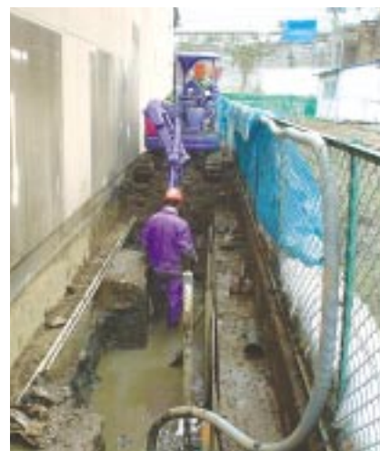
事業用借用地の土壌改良工事

2004年12月、リコーの事業用借用地(神奈川県厚木市)から、軽微なふっ素汚染が検出されました。これは、借用地の返却に伴い、条例(2004年10月改定)に基づく調査を行った結果判明したものです。リコーでは、早急に専門業者を交えた対策チームを作り対策計画を策定しました。そして、地主様ほか関係者・自治体への報告を行い、2005年3月末に浄化を完了させました。