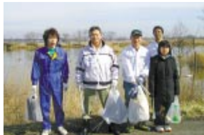
伊豆沼・内沼クリーンアップ／迫リコー 3月20日、社員7名がラムサール条約登録湿地であり、白鳥・真雁の飛来地である「宮城県伊豆沼・内沼」の清掃ボランティア活動に参加しました。