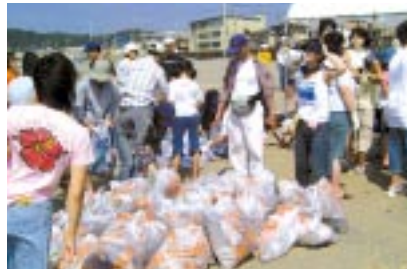
鎌倉ビーチクリーンアップ 9月19日、鎌倉市「材木座海岸」にリコーグループ社員と家族115名が集まり、ごみ拾いを行った後、サンドクラフトを楽しみました。