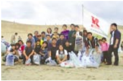
鳥取砂丘一斉清掃／リコー鳥取グループ 9月26日、「国立公園・鳥取砂丘」の一斉清掃にリコー鳥取グループ社員90名が参加。毎年継続して行われている活動の効果で、年々ごみの量は減少しています。