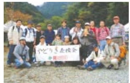
やどりき水源林保全 10月23日、リコー環境ボランティアグループ「やどりき森睦会」の社員と家族17名が「水源林の集い」(神奈川県主催)にパートナー企業メンバーとして参加しました。