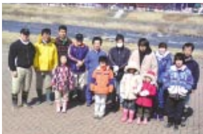
白石川河川敷清掃／東北リコー 3月19日、「日本のさくらの名所100選」に選ばれている宮城県柴田町で開催される「しばた桜まつり」に向けた白石川河川の清掃活動に、社員と家族14名が参加しました。