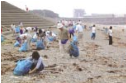
沼津千本浜クリーンアップ／沼津事業所 6月27日、静岡県沼津市で行われた「2004フェスタ・コスタ・テル・ゴミIN千本浜」(参加者約800人)に社員25名が参加。海岸に漂着した大量のごみを回収しました。