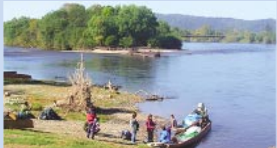
ビキン川流域：ハバロフスクとウラジオストクの間にあり約13,000平方キロ、ほぼ東京、神奈川、千葉、埼玉を合わせたくらいの広さ。