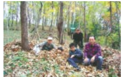
秦野雑木林保全 12月12日、「秦野雑木林を守る会」のメンバー5名が「自然いっぱいの雑木林で汗をかこう」と題して、神奈川県秦野市にある「震生湖雑木林」で落葉掻きを行いました。