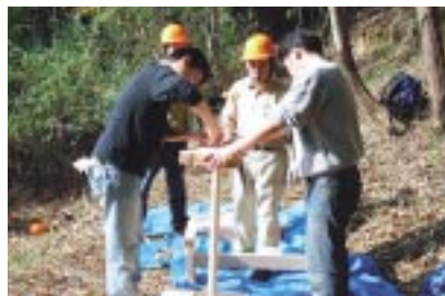
五月山の里山保全／池田事業所、やしろ工場 11月20日、大阪府池田市にある「五月山」の活動に社員と家族が参加。リコー社会貢献クラブ「Free Will」の支援金で購入したテーブルセット2台を展望台に設置しました。