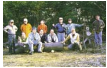
獅子ヶ谷緑地保全 2月5日、「獅子ヶ谷緑地保全会」メンバー15名が横浜市「獅子ヶ谷緑地」で、梅林の枝剪定と樹木の伐採、柵整備などの景観保全活動を行いました。